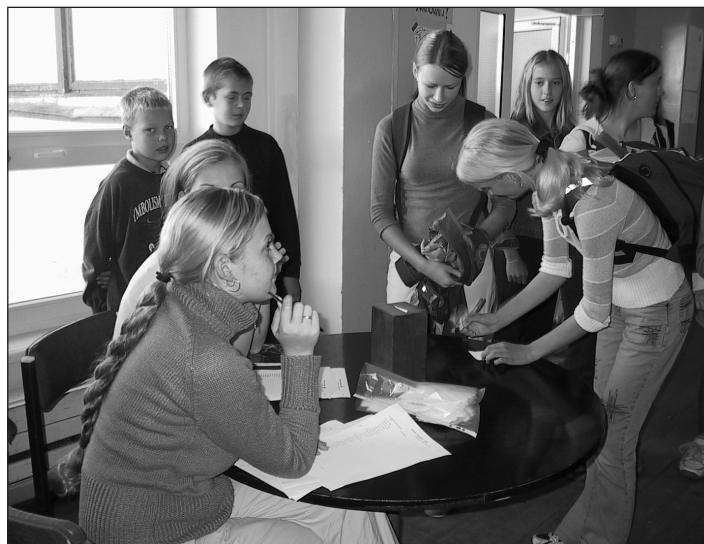
Foto eelmise aasta õpilasesinduse valimistelt.

Kandidaatide abistamiseks võib moodustada valimistoimkonna, kes aitab teda reklaamida ja ette val-