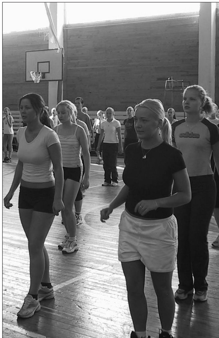
Allkiri. Eelmise aasta spordipäev. Aeroobika äkki?

Alad, millel kohtade arv on piiratud ja registreerimine toimub kehalise kasvatusõpetajate juures, on järgmised: tennis, bowling + jõusaal + ujumine, aeroobi-