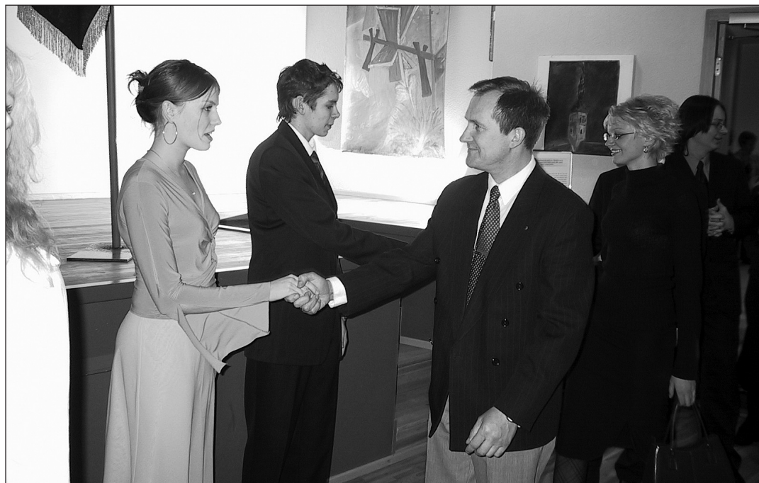
Hetk 26. veebruaril toimunud KG Eesti Vabariigile pühendatud aastapäevaballist.

Neljapäeval, 26. veebruaril toimus Kuressaare Kultuurikeskuses kümnendate klasside poolt korraldatud ball gümnasistidele. Ma arvan, et kõigil, kes sinna kohale ei tulnud, on, mida kahetseda.