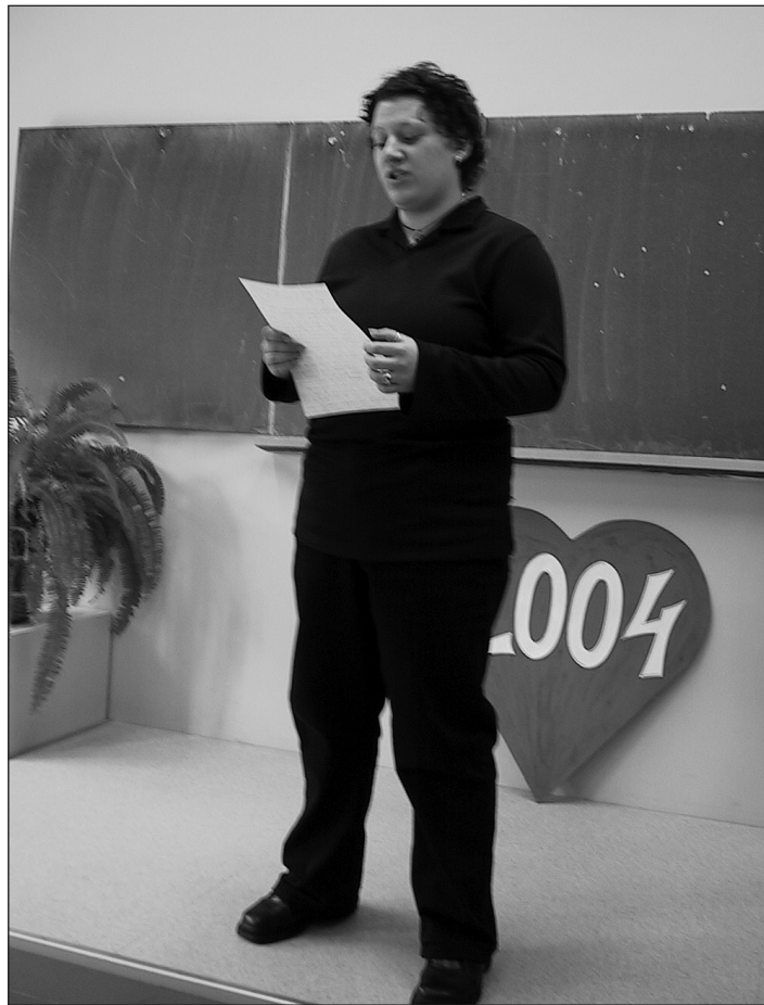
Mary maakonna kõnevõistlusel esinemas.

Tore oli see, et üksi võistleja ei pidanud tunnustusega lahkuma. Välja anti I, II ja III koht ning eriauhindu. Näiteks: artistliku esinemise eest, siiruse, vaimu-