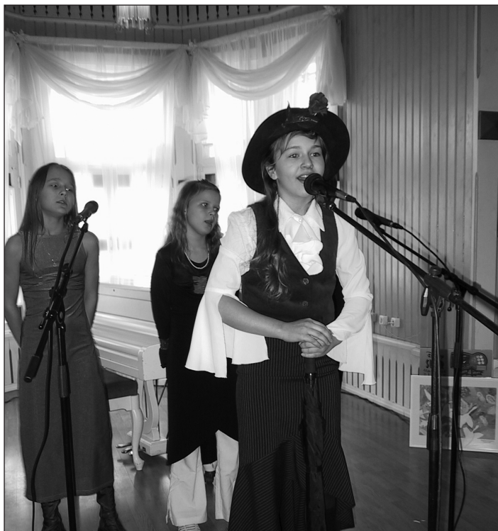
Hetk möödunud aasta algklasside solistide konkursilt.