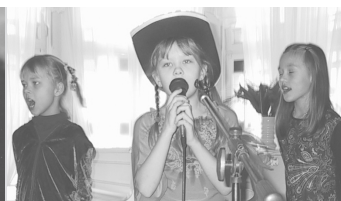
Lk. 5 Linnateatris valitakse algklasside KG "laululind" 2005.