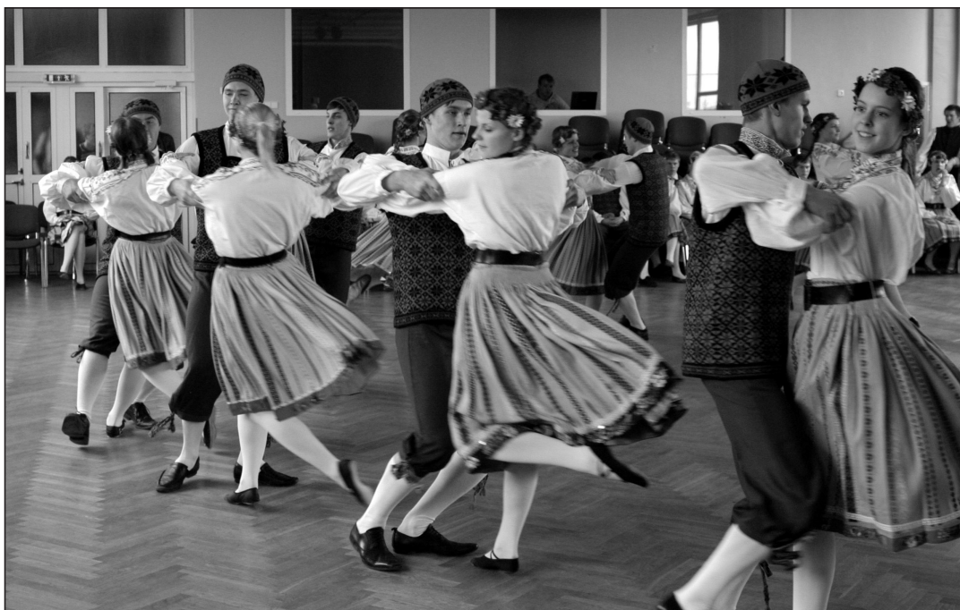
Sõlesepad näitasid noorte tantsupeo II ülevaatusel tantsulusti