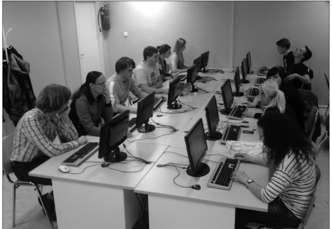
Nii me seal siis võitlesime oma esimeste hullumeelsuse sümptomitega

Igal juhul kõik algas siiski positiivselt. Kõigil oli tuju hea, aju töötas täisvõimsusel ja oli muidu tore olla. Mitmete tundide möödudes oli olukord sootuks teine, näha võis ka esimesi TTA kõrvalmõjusid: mõni magas klaviatuuri ees; mõni, kes oma jutu järgi kuulab ainult heavy metalit laulis hetk tagasi terve Enrique Iglesiase laulu peast ära ning üks õnnelik, kes ainsana oma töö kusagil kella 9 ajal valmis sai hakkas lihtsalt klassis ringi tantsuma, ise samal ajal lauldes: „Mul on TTA valmis, mul on TTA valmis“ (siinkohal ter-