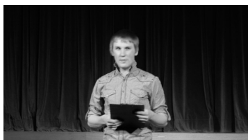
Lk 2 KG etlejad olid tublid vendade Liivide luulekonkursil