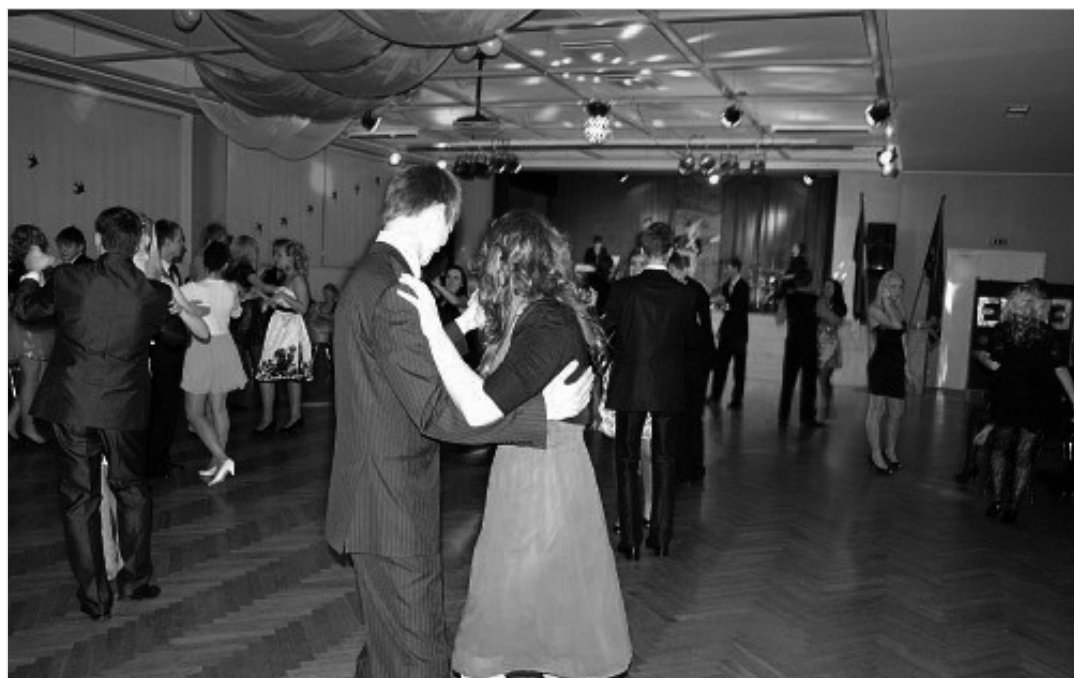
Kümnendikud ballil värskelt omandatud tantsuoskusi näitamas

Möödunud nädala teisipäeval toimus meie koolis traditsiooniline Eesti Vabariigi sünnipäeva aukspeetud ball. Kõikidel kümnendikel tuli pidulikult rietatult kohale tulla hiljemalt viis minutit enne kuute. Aulas tuli esimesena a, b ja c klassi esindava noormehe ja neiuga tervituseks käetelda.