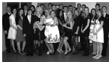
Lk. 3 KG vabariigi aastapäevale pühendatud balli muljed