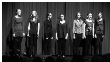
Lk. 2 KG tublimad, parmiad, osavamad esinevad galal