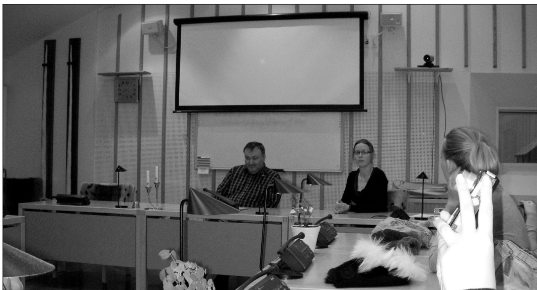
Sisimiuti linnapeaga kohtumine