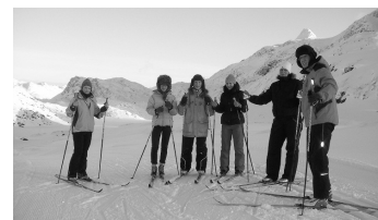
Lk. 4 KGkad suurimal saarel - Gröönimaal