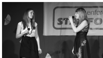
Lk. 3-4 Maakonna parimad solistid ja duetid!