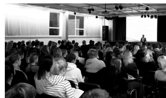
Lk. 5 Õpilaste koosolek uut moodi!!