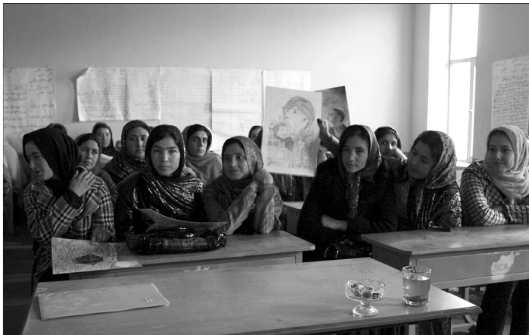
Afganistani õpilastele viidi Eesti õpilaste poolt saadetud töid.