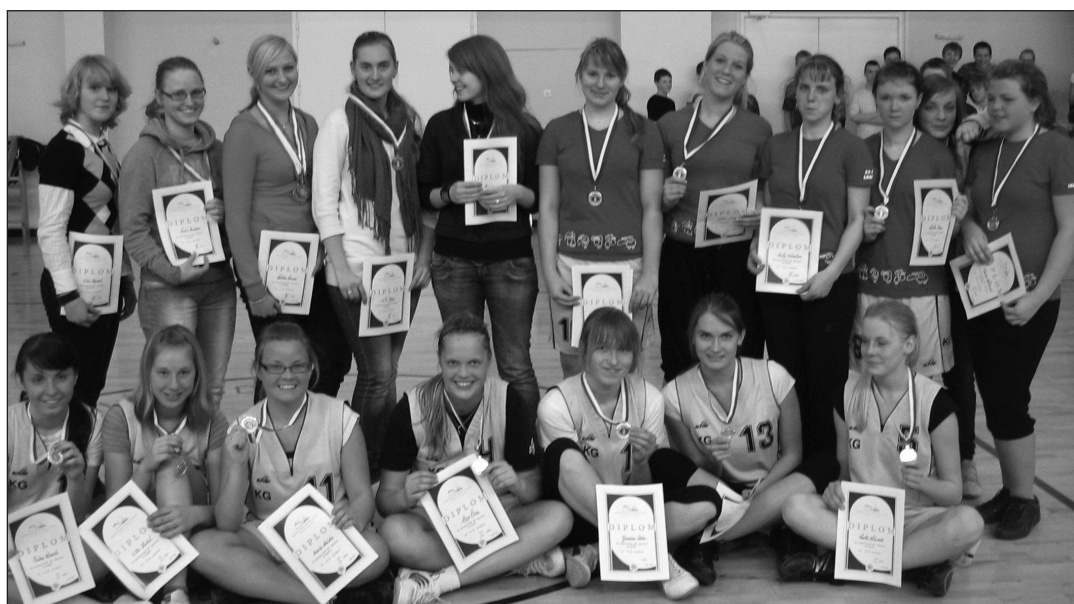
Meie õnnelikud võitjad.

Lõppesid kooli tütarlaste meistrivõistlused korvpallis. Tulemused olid: