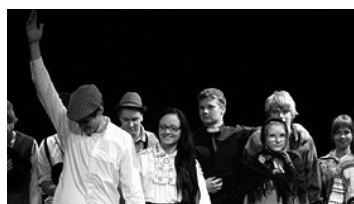
Kuidas 11A vabariikis kalavõrguga kaks preemiat püüdis