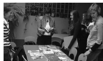
Lasteraamatupäeval loeti ette ja vahetati raamatuid