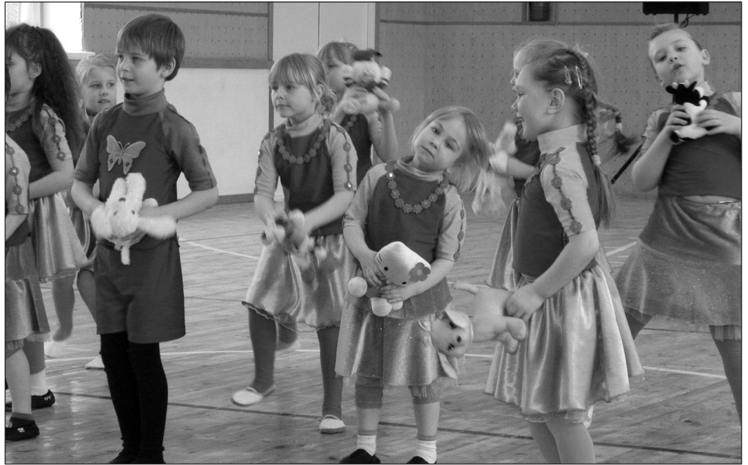
4-6-aastased saavutasid kavaga "Minu loomad" parima showkava karika.