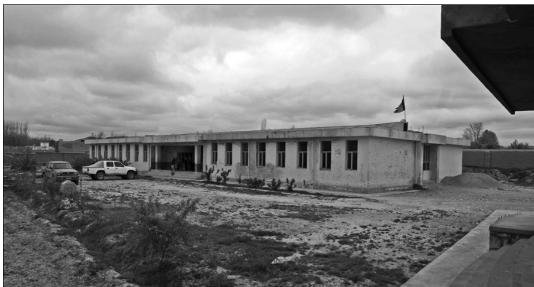
Tüüpiline Afganistani koolimaja.