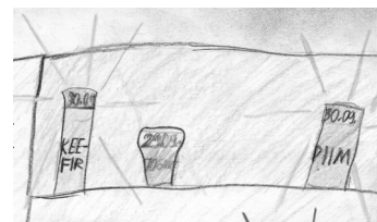
Lk. 4 Spikriprillidest ja säilivusaja märgistajast, tutvuu hoolega!