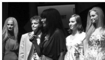
Lk. 2 KG Look ootab taas osalema noori andekaid moeloojaid!