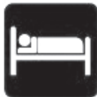
HAIGENA JÄÄ KOJU!

Pese tihti käsi - see kaitseb sind ja sinu lähedasi viiruste eest. Iga kätepesu kestku vähemalt 20 sekundit. Just kätele jääb kõige rohkem viiruseid ja sealt satuvad need edasi sinu organismi või teistele inimestele.