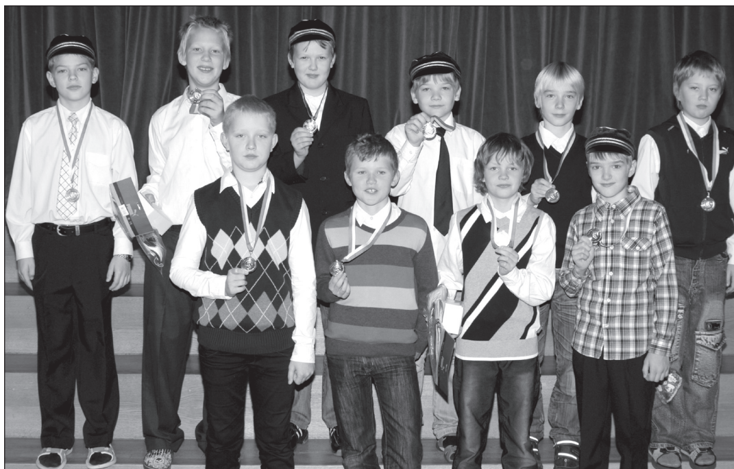
Meie KG avaldas eelmises numbris ekslikult vale foto meie jalgpallikangelastest. vabandame ja soovime palju õnne meie medalimeestele! Ootame uusi võite ja õnnestumisi palliplatsil!