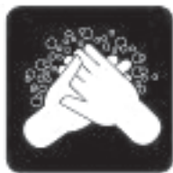
PESE TIHTI KÄSI

Uue gripi sümptomid ja levikuteed on sarnased hooajalisele gripile. Kliiniline pilt: järsk enesetunde halvenemine, palavik üle 37,8°C, külmavärinad, köha-, pea-, kurgu-, lihas- ja/või liigesvalu, väsimus ja nõrkus. Või-