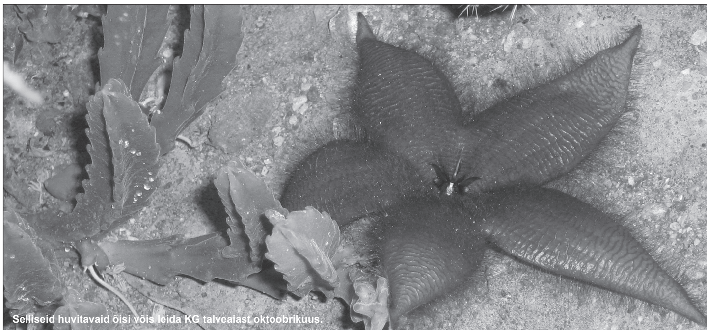
Selliseid huvitavaid õisi võis leida KG talvealast oktoobrikuus.