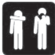
AEVASTADES KATA SUU!

4+4 lihsat, kuid tõhusat nippi gripist hoidumiseks http://www.gripivastu.ee