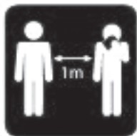
HOIA HAIGEGA VAHETI

vad esineda ka seedejäred nagu iiveldus, oksendamine, kõhulahtisus, mis ei ole tavalise gripi tunnusteks.