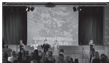
Lk. 2 Kooli aulas saab loovutada verd regionaalhaigla verekeskusele

Mari-Liis Sepp, ÕE liige õ-luse propageerija