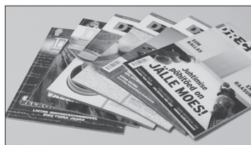
Lk. 3 Kannapööre juhtimises ehk Kiviaeg lõppes kivide lõppemisel