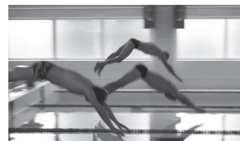
Lk. 4 Ujume kui kalad vees, aga tulemustest loe täpsemalt!