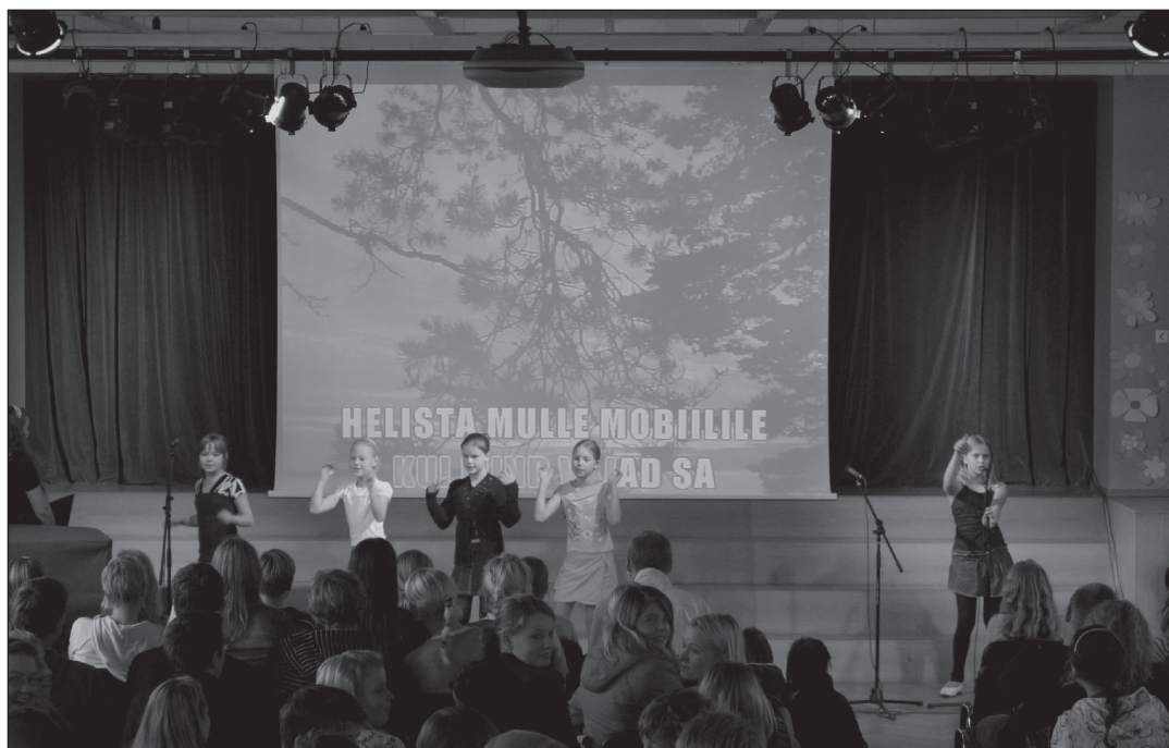
Karaoke oli, on ja jääb-)