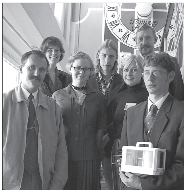
Õpetajate päeva direksioon, oktoober 2002.

11. okt. 2006 - KG's algavad võistluskunstide treeningud, valida oli lausa viie erineva stiili vahel - ninjutsu, gijimonkai karate, kendo ja iaido, võistluskunstistilide õpetajaks Raivo Paasmaa.