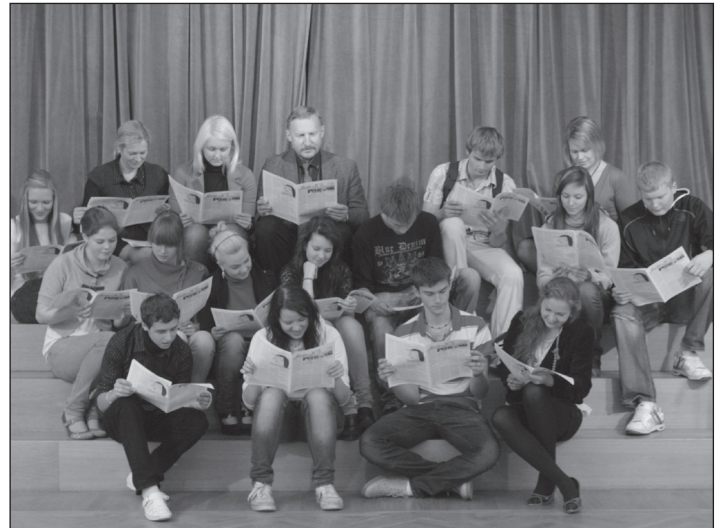
Õpilastele ajaleht meeldib!

U. T : Kooli leht peab olema oluline ja huvitav oma sihtgrupile ehk koolirahvale. Juba erinevas vanuses noorte ja ka õpetajate huvi äratamine samas lehes on paras pähele. Mis mulle on silma hakanud, et kirjutada saavad teie lehes kõik, kel sulg jookseb. Väljendusoskuse ja avalikkuse surve talumise