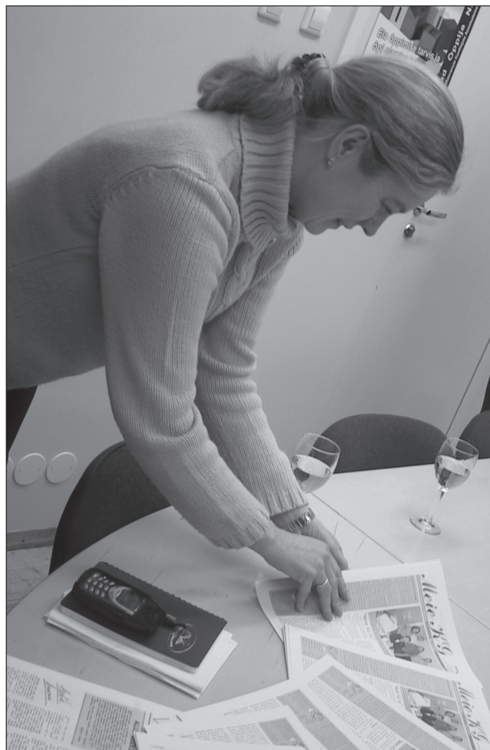
Meie KG esimene number saabub trükikojast. Jaanuar 2003.

Rita Ilves, SÜG-i eesti keele õpetaja: Loen teie lehte pisteliselt. Vahel iga numbri ilmumispäeval, vahel jääb mõni nädal vahele, siis vaatan mitu lehte korra-