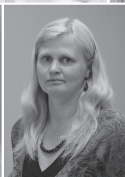
Kuressaare Gümnaasiumi vanempedagoogid