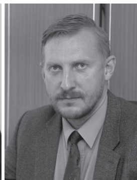
Kuressaare Gümnaasiumi pedagoog-metoodikud

duskoolituse läbiviimisel, vanempedagoogiks atesteerimise puhul 40 ning pedagoog-metoodikuks atesteerimise puhul 60 tunni ulatuses, mida tõendab registreeritud organisatsioon;