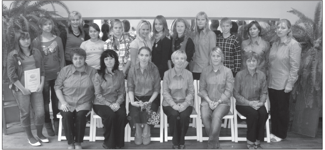
Kuressaare Eralasteaia õpetajad ja õpetajate päeva õpetajad

5.oktoobri hommikul oli Keslinna Eralasteaia juhataja kabinet signinat-siginat täis. Toa olid vallutanud lasteaia vilistlased, kellele juhataja jagas veel viimaseid näpunäiteid õpetajatöö kohta. Vilistlastel nimelt seisis ees erakordne võimalus lasteaiaõpetajaid asendada ja ise järele proovida, kuidas see, nii mõnelegi vaid mängimisena tunduv õpetajatöö lasteaias käib.