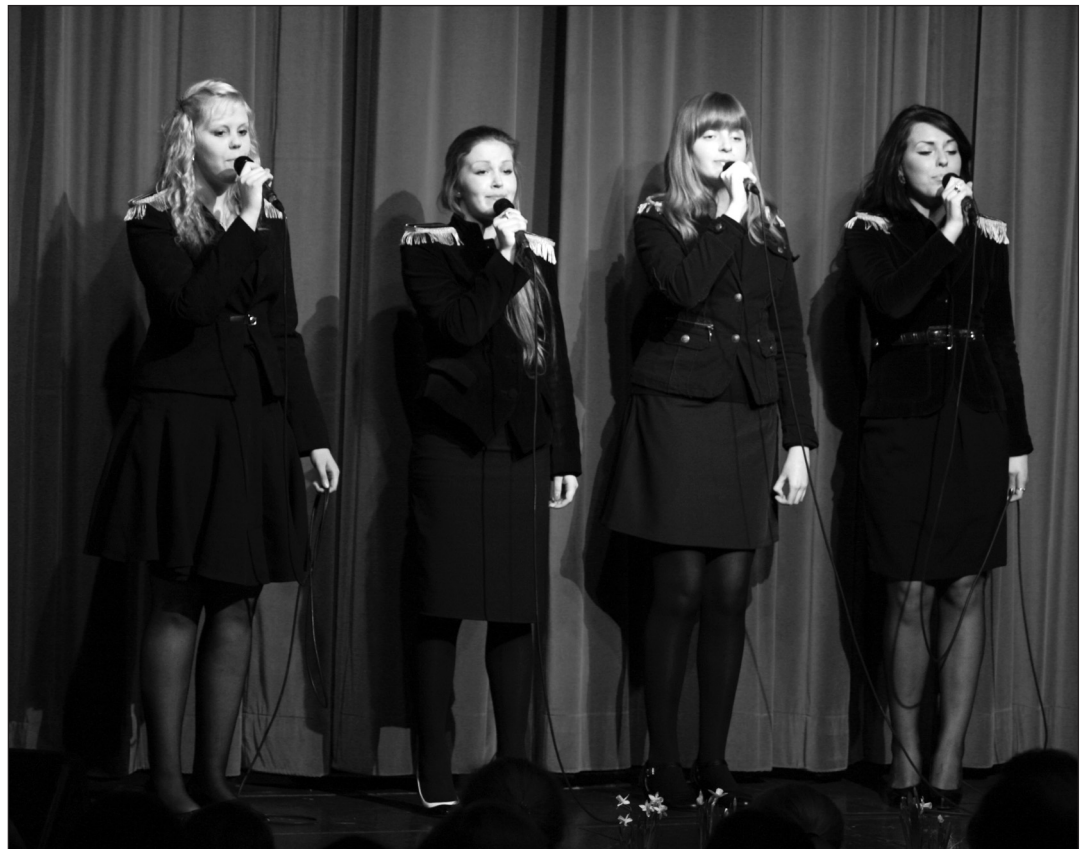
Mandlike 2009. aasta galakontserdil.

6.-7. märtsil Jõgeval toimunud üleriigilisel ansambelite konkursil saavutas KG huvikooli Inspira lauljatest oma vanuserühmas 1. koha tütarlaste ansambel Mandlike (juh. Pilvi Karu).