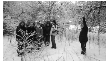
Lk. 3 Kuidas 10 c metsas käis ehk Mina olin metsa minemas ja...