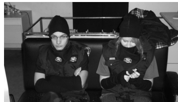
Lk. 2 Kaugele on jõudnud meie keeleväelased, loe ja pea põialt!