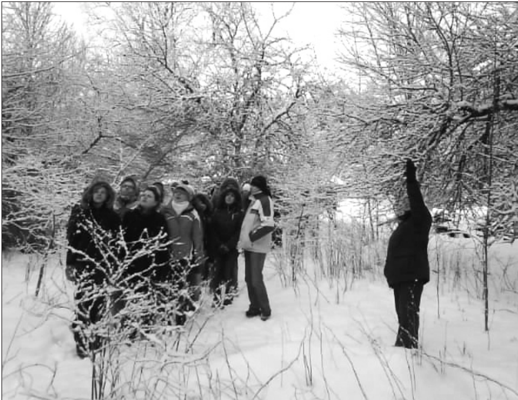
10C metsaelu avastamas

Päev pärast vabariigi aastapäeva balli oli meil klassiga kavandatud väljasõit Mustjalga. Eelmise õhtu hiliste tundideni kestnud tantustrall andis unisuse näol end ka hommikul veidi tunda, aga kolmveerandtunnine bussisõit Leisi, kus meie ringreis alguse pidi saama, oli täpselt paras, et veidi enne metsas ringimüttamist veel korraks tukastada. Leisis külastasime üht vanaaegset talumaja, millest oli tehtud muuseum. Seal tutvusime vanema aja talutööriistadega ja külma trotsides tegime ka metsas ühe parajalt pika tiiru. Metsamatkal õppisime tundma puid,