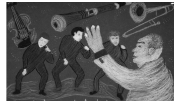
Lk. 4 "Eestimaa tuntud ja tunnustatud inimesed" - parimad pildid