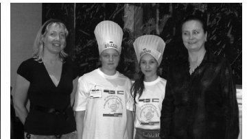
Lk. 6 Meeleolukas reis Tür- gimaale ehk kuidas meil seal hästi läks:-)