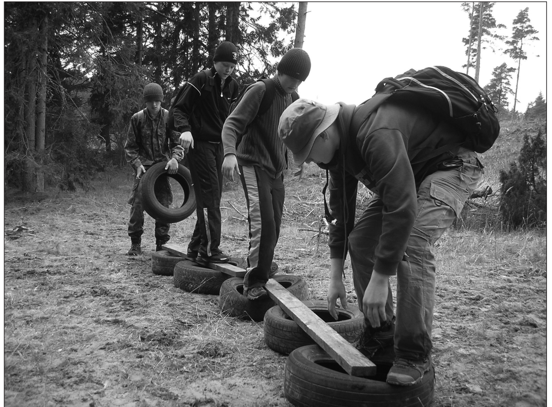
Võistlusülesanne "Soo ületamine" nõudis loogilist mõtlemist ja meeskonnatööd.

Elmisel nädalavahetusel osales KG noorkotkaste võistkond maakondlikul matkamängul Vesse, millega tähistati Jüriöö ülestõusu aastapäeva ning selgitati Saaremaa parimaid noorkotkaste ning kodutartide võistkondi, keda saata suvel üleriigilistele võistlustele.