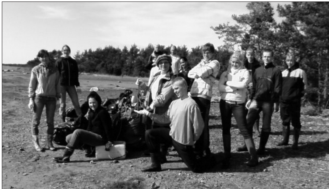
Rõõmus ja õnnelik koristusmeeskond - 240 kg prügi kokku korjatud!.