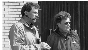
Lk. 4-5 Saame tuttavaks spordi- ja tantsu- osakonnaga!