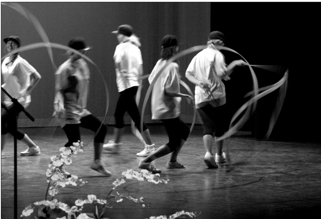
8B klassi võimlemiskava.

Suured-suured tänud eelkõige peakorraldajale Laine Lehtole ja kõigile suurepärasele lauljatele-tantsitajatele-võimlejatele-etlejatele-pillimängijatele ning nende juhendajatele ja üldse kõigile, kes kontserdi korraldamisele kaasa aitasid ning selle toimumise võimalikuks tegid. Kohtumiseni juba järgmisel kevadel, Kuressaare Gümnaasiumi galakontserdil 2009!