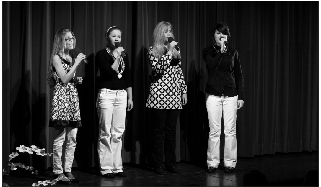
Tütarlasteansambel Mandlike

Kontsert oli jagatud kahte ossa: esimeses pooles 16 esitust ning teises osas peale 15-minutilist vaheaega ülejäänud 18. Ehk siis ühtekok-