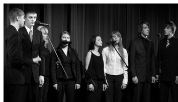
Juubelihõnguline galakontsert oli muljetavaldav, aitäh tegijaile