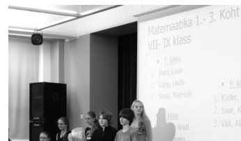
Lk. 4 Hindamisjuhendis on muudatusi, olge toimuvaga kursis!