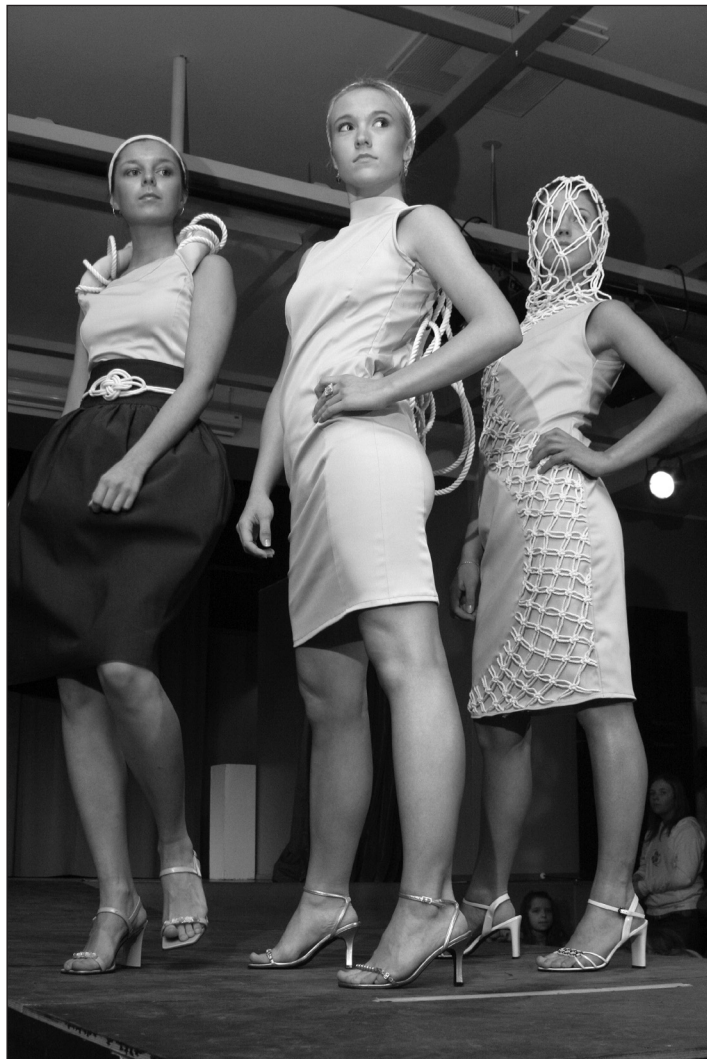
10.-12. klass I koht, 11F klassi kollektioon "Paelumine", autor Katrina Kaubi.

Vanimas vanuseastmes võitis 11f klassi kollektioon "Paelumine", sellele järgnesid tasavägiselt 10b klassi kollektioon "Sierra Leone" ning 10 e klass kollektiooniga "Lilleline elu-