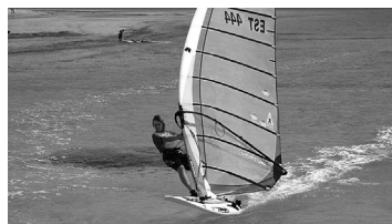
Lk. 3 Kuidas ja kus veeta maksimaalselt koolivaheaga?