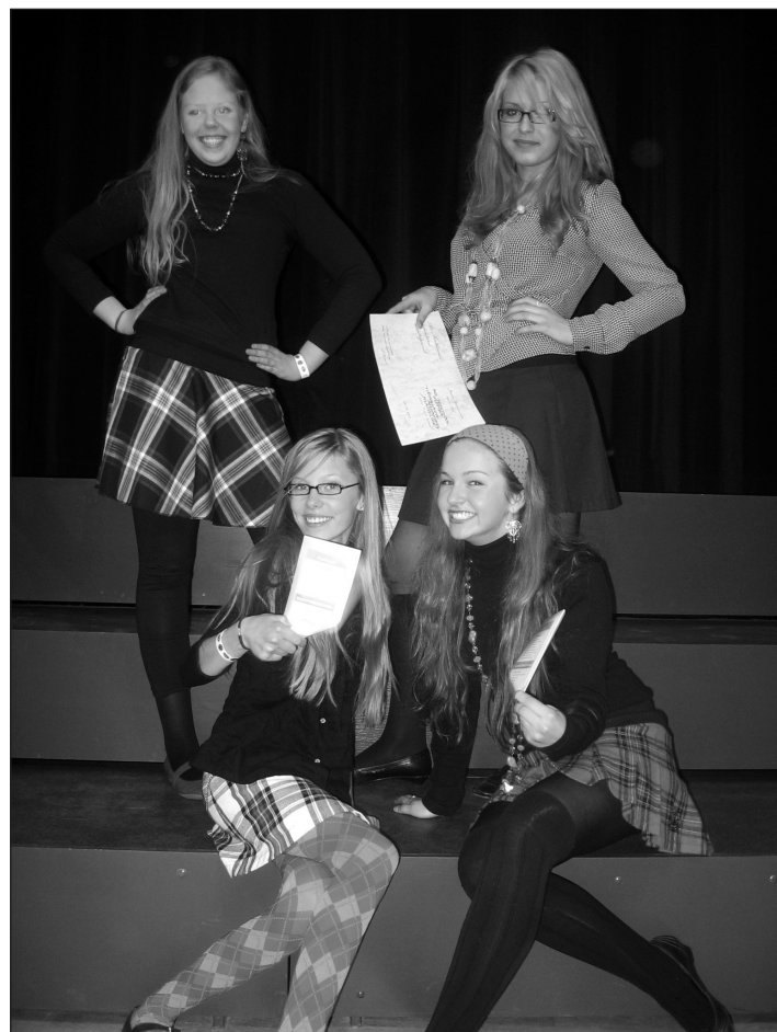
Mandlike neid pälvisid Jõgeval esikoha! Palju õnne!

„Suur kõrv” võib olla ka karm. Paari laulu ajal kat- sid nad kõrvad või raputa-