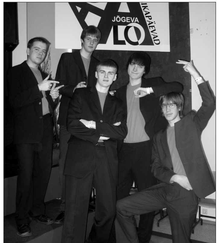
Siin meie võidukad päästjad ongi - noormeesteansambel Jepps.