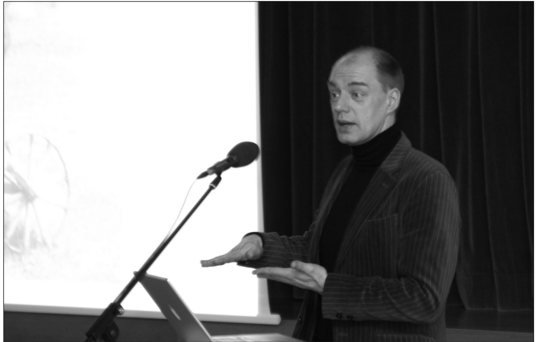
Reedel, 9. märtsil esines meie õpilastele infotehnoloogia spetsialist-visionäär Linnar Viik, kes rääkis innovatsioonist ja sellest, kuidas oma ideid ellu viia.