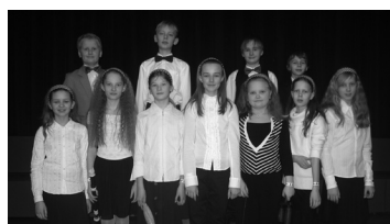
Lk. 3 Keda või mida päästab Jepps ja enamasti Jõgeval toimunud