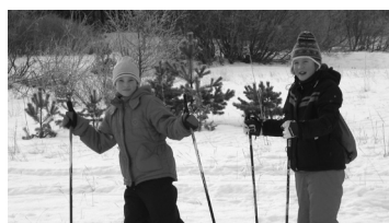
Lk. 2 Mis juhtus, vaatamata sellele, et KG talispordipäev ära jäi?