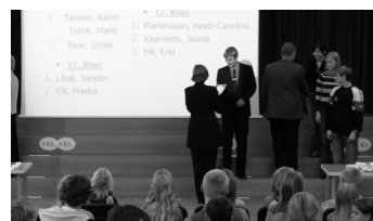
Lk. 5 Meie koolis korraldatud aineolümpiaadide parimad selgunud!