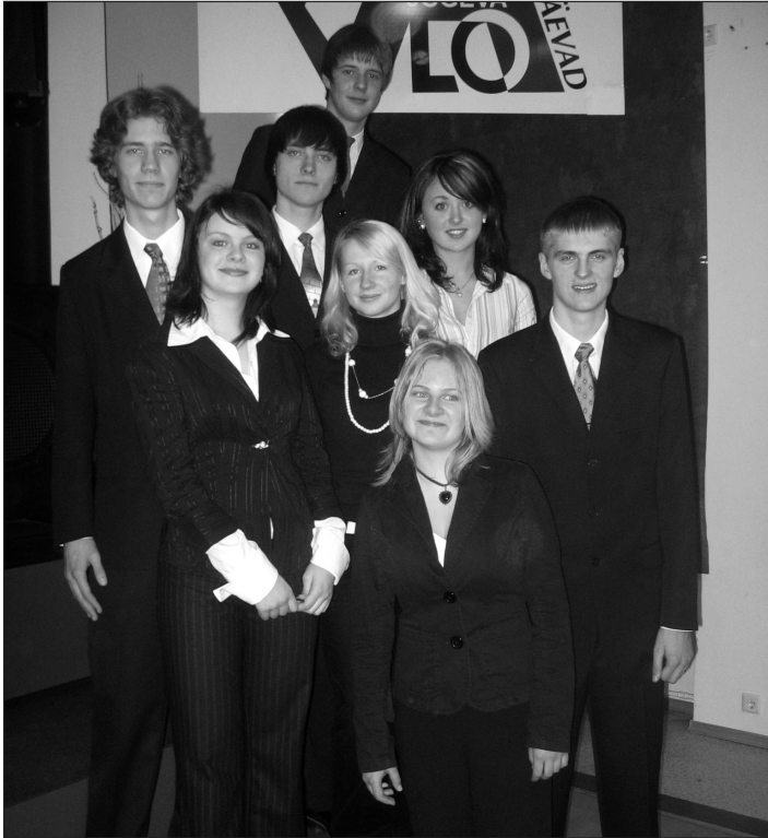
KG segaansambel Sa:arlaine saavutas Jõgeval 4. koha.