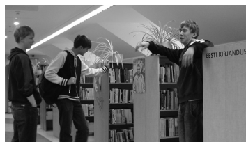
Lk. 3 Uued, huvitavad artik- lid kooli raamatuko- gus - tule lugema!