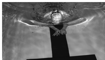
Lk. 4 Tublid ujudjad naasesid parima võimaliku saavutusega!