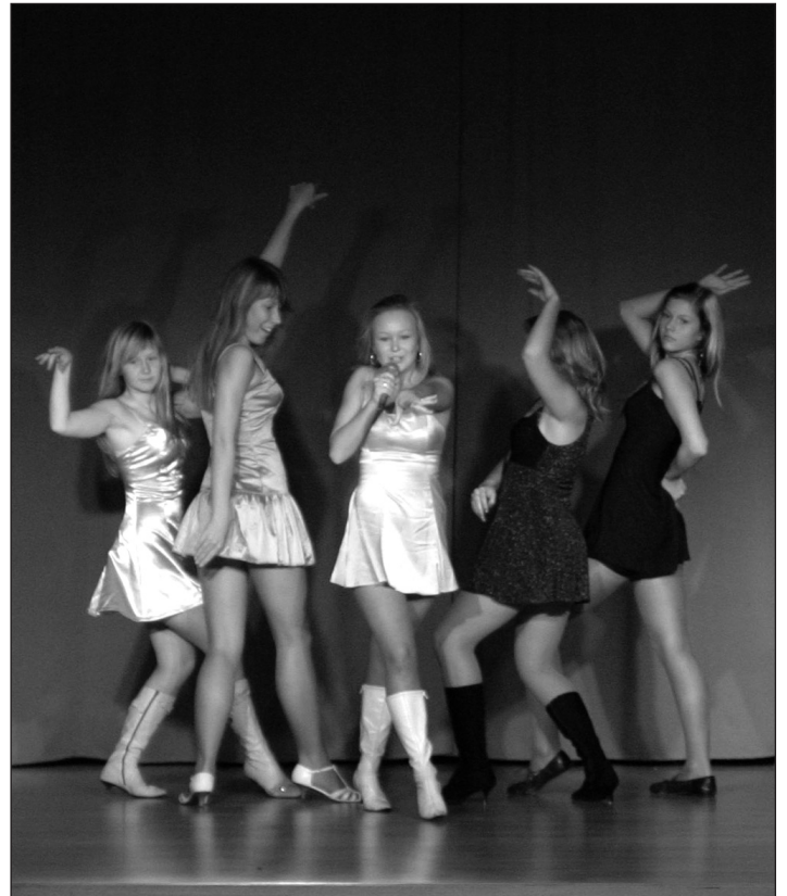
10E - Gümnaasiumiosa parim jälgendaja.