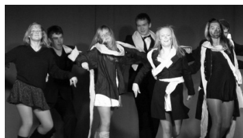
Lk. 2 Playback küttis kirgi ja loomulikult tekitas erinevaid arvamusi.