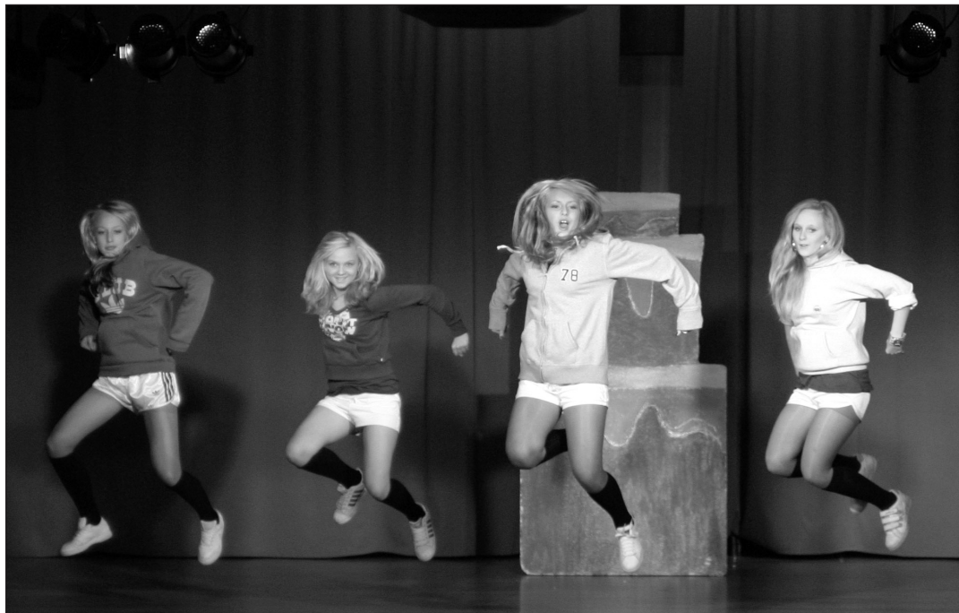
7B esituses Fergie „Fergalicious”.