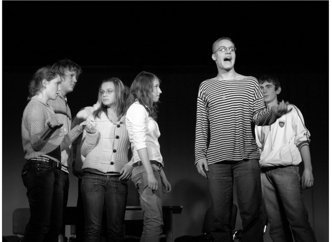
9C klass võitis Grand Prix etendusega Betti Alveri luuletuse "Ants Ablas" ainetel.