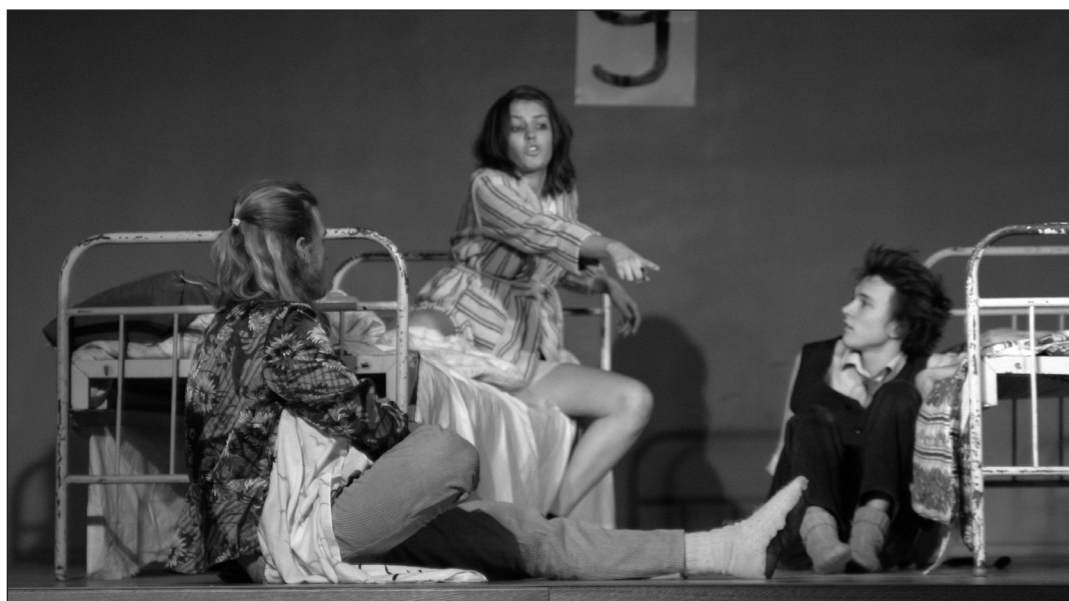
Suur Teatriõhtu 2005 Grand Prix.

Kõik teavad, et Suur Teatriõhtu on kohe-kohe ukse ees. Niisiis otsustasime mõnelt gümnaasiumiõpilaselt teatriõhtu ettevalmistuste kohta pärida. Õpilastel tuli vastata paarile küsimusele.