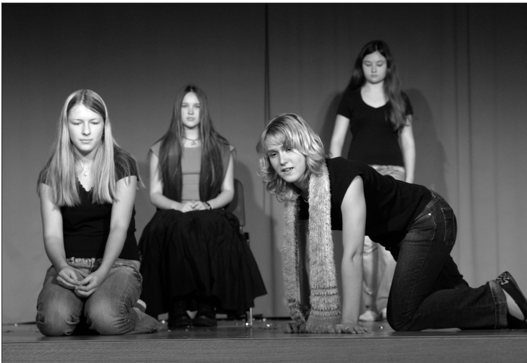
9B klassi etendus pälvis parima stsenaaristi preemia.