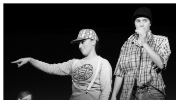
Lk. 2 Põhikooli Teatriõhtu moodus menukate etendustega.