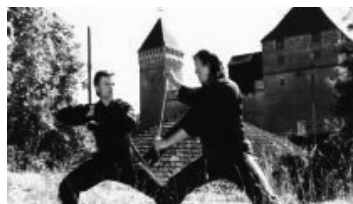
Lk. 1 Idamaiste võitluskunstide treeningringid Inspiras!