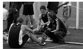
Lk. 3 Spordipäeva tulemused ja tagasiside õpilastelt.