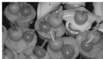
Lk. 2 Leivanädala ürituste kokkuvõtet saad lugeda siit.