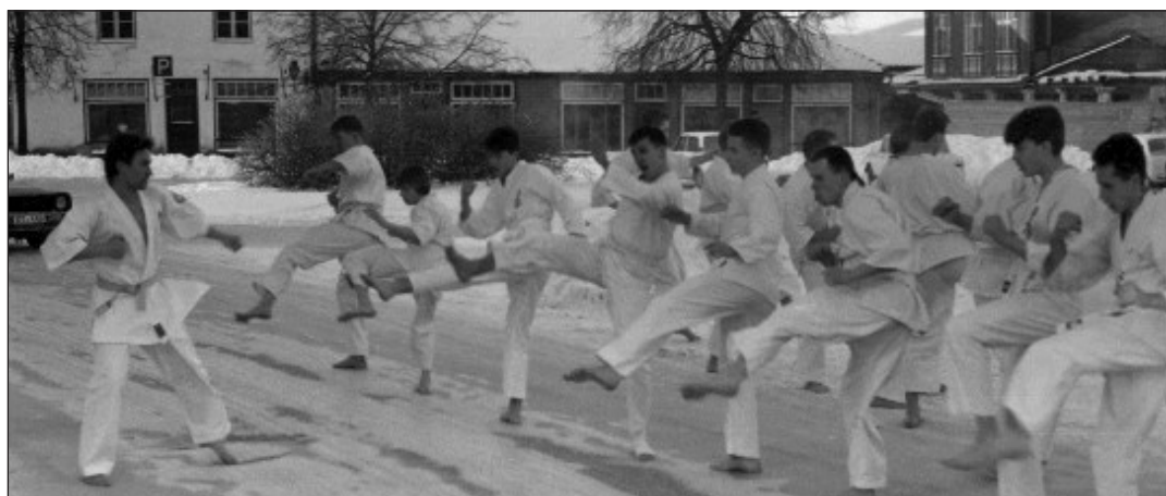
Esimesed Eesti meistrivõistlused Kyokushinkai-karates, Traditsioonilise võistluse avamise hetkel päikesetõusuga... välistemperatuur -24 kraadi.

KG Huvikoolis Inspira alustavad oktoobri keskpaigast tegevust erinevate idamaiste võitluskunstide treeninggruppid.