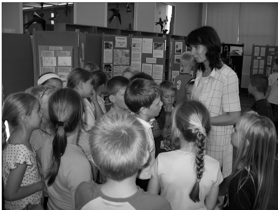
Õpilased praktikakonverentsil.