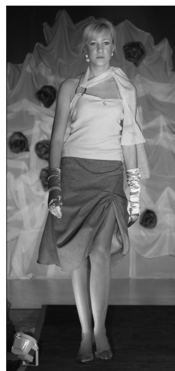
Suusatamine, Spordipäev ja KG's Fashion Show annavad kõik punkte klassidevahelises võistluses.