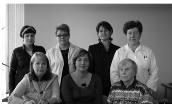
Lk. 4 Õpiabi võimalustest koolis loe viimastelt lehekülgedelt.