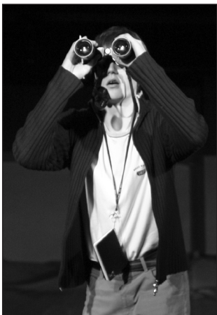
Jälgi sinagi tähelepanelikult Suure Teatriõhtu infot KG kodulehel ja ajalehes Meie KG!