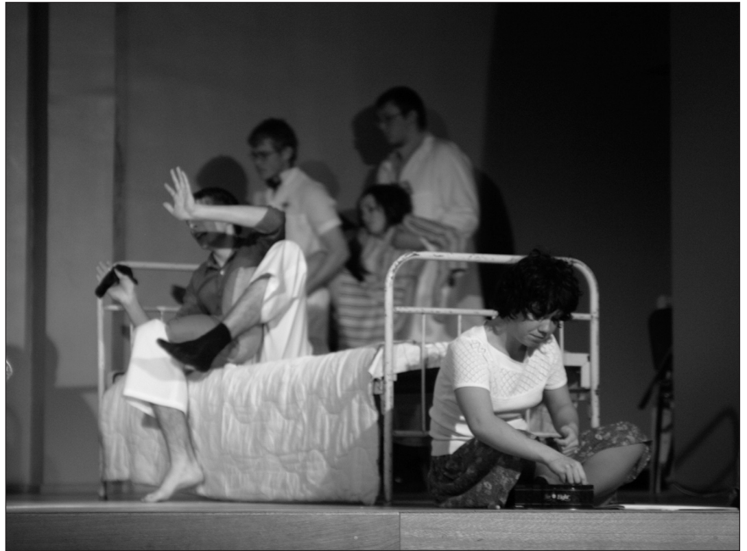
"Üheksas", Suure Teatriõhtu 2005 Grand Prix.