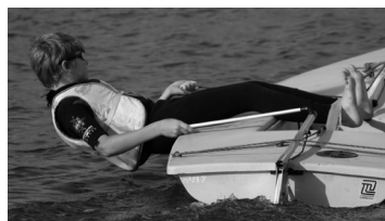
Lk. 3 Klassidevahelise võistluse juhendiga saad tutvuda siit.