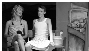
Suur Teatriõhtu on peagi tulemas. Ole valmis.