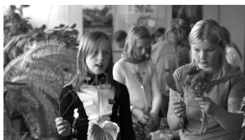
Lk. 1 Ülekooliline taimeseade konkurs on algamas