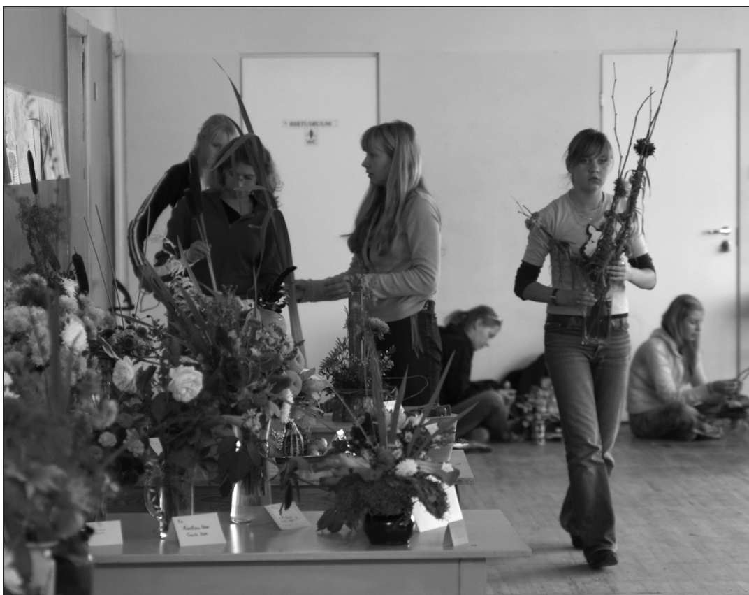
Taimeseade konkurs.

Toimumise aeg: 26. september 2006. a. alates kella ühest vastavalt klasside tundide lõppemise ajale. Selleks on vajalik eelregistreerimine huvijuhtide toas (ruum 239) hiljemalt 25. septembriks.