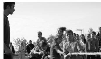
Lk. 4 Kogu info spordipäeval toimuva kohta leiad siit!