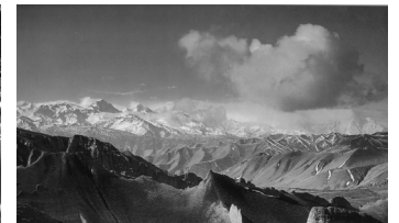
Genadi Noa viimane osa reisimuljetest In- diasse.