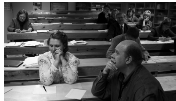
Mida tehti vaheajal koolituskeskuses Osilia.