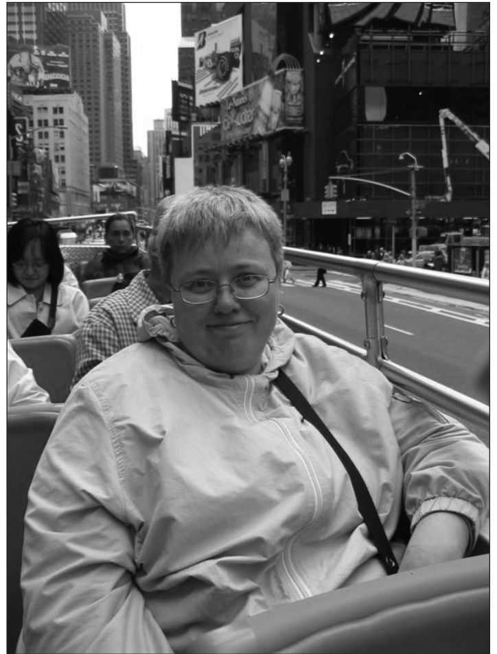
Kaja Tampere New Yorgis.

Ning kui teine ei mõista või ei saa aru, siis mitte tema ei ole rumal, vaid see, kes sõnumit saadab (see kes räägib või kirjutab jne) on olnud vähe hoolikas, halvasti mõistetav. Mõistmise ja arusaamise jaoks on ka oluline see, et nii sõnumi saatja kui vastuvõtja peavad maailmaasjadest sarnaselt aru saama. Sellest tulenevalt on suhtekorraldusel ka selline oluline taustainfo andja, taustateadmise looja või isegi õpetaja roll, et see inimene, kes peaks si-