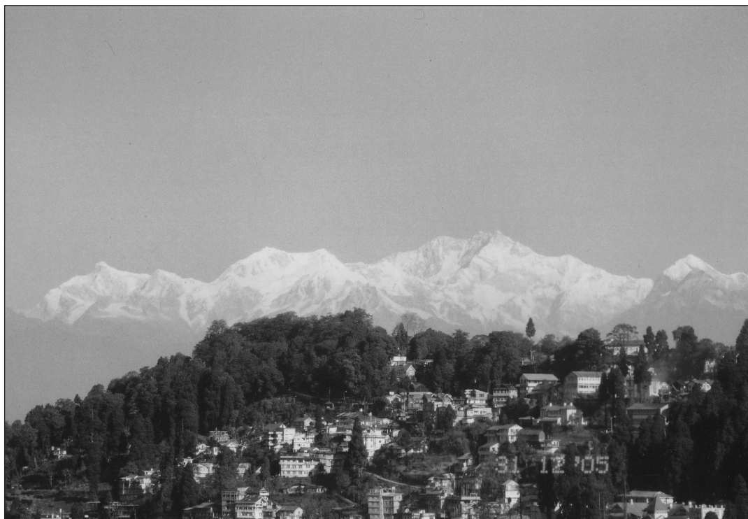
Himaalaja mäed Darjeelingist nähtuna.