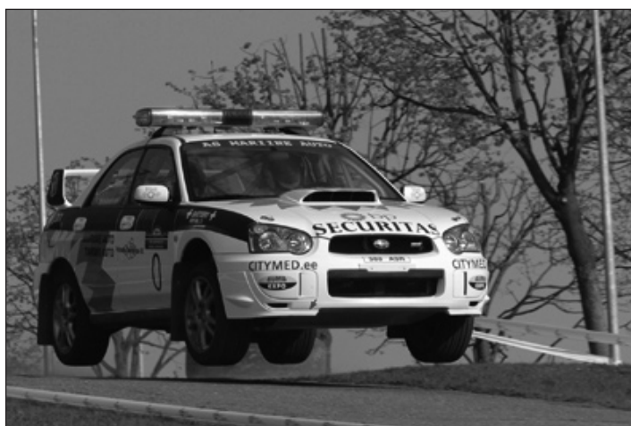
Ahti Sepp on katsetanud kaardilugeja ametit.