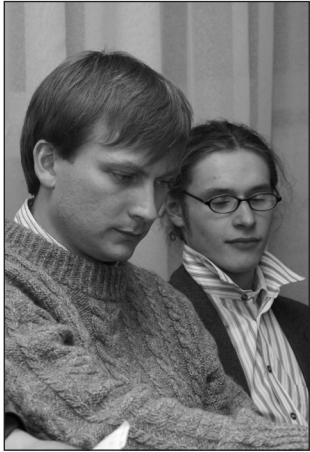
Žürii otsustamas.

Juhend: Teatritulle astuvad kõik 10. – 12. klassid, kelle ülesandeks lavaküpseks harjutada kuni 10minutilise näitemäng 1960. aasta te keskpaiku eesti proosas tulnud noorte autorite loomingu. Dramatiseerida ja interpreteerida võib seega Mati Undi ja tema kaasaegsete: Arvo Valtoni, Enn Vetemaa, Mats Traadi, Teet Kallase, Aimee Beekmani, Jüri Tuuliku ja Ülo Tuuliku loomingu.