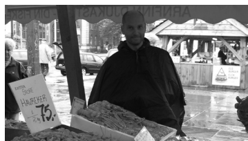
Õpetajad trotsisid vaheajal Norra järske mägiteid.