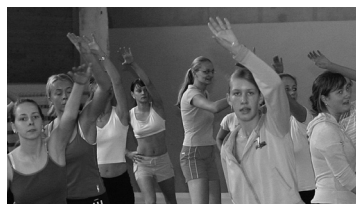
Sportipäev on tulemas! Esimene info selles ajalehes.