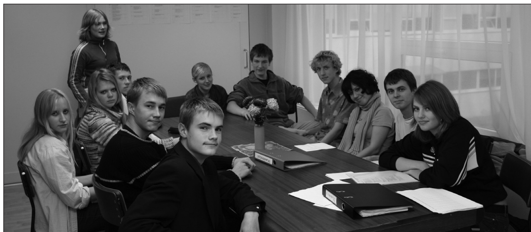
KG Õpilasesindus 2004/2005 õ. a.

23. -28. september on kõigil aktiivsetel noortel võimalus endast märku anda. Seda kas plakatile, kõnedega väljakutel või flaieritega - nimelt on lähenemas Õpilasesinduse valimised. Eelmisel tööaastal jäi püsivaks grupp inimesi, kes kõik olid väga aktiivsed ja huvitatud oma tööst. Kahjuks on aga eelnevad aastad näidanud, et alati see nii ei ole. Kuna praegused liikmed on huvitatud esinduse püsijäämisest, katsetame sel aastal uut valimissüsteemi. Esialgu võib see õpilastele tunduda veider ja keeruline, ent püüdsime välja arendada süsteemi, mis garanteeriks, et valitav liige oleks võimeline oma arvamust avaldama ja tiimis töötama.