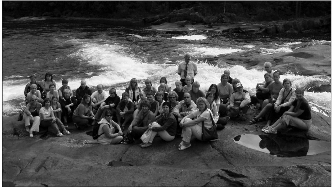
Üle 6000 aasta vanuseid Dokka kaljujooniseid vaatamas.