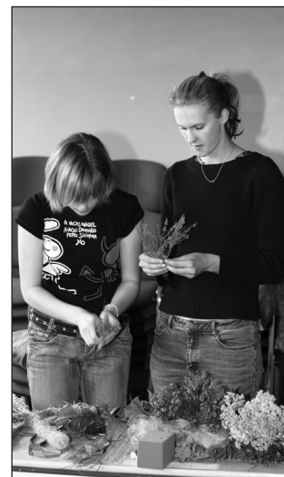
Võitjad 2004