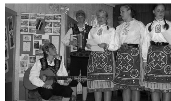
Õpilased käisid Poolas lausa mitmel korral.