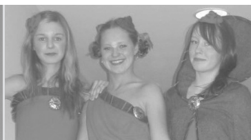
Lk. 3 KG õpilaste kollektsioonid School Fashion Show'1 2005.