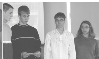
Lk. 6 Õpilaskoosolek teemal "Meie kool meie klassi pilgu läbi".