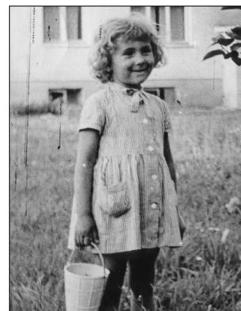
Ülle Jasmin.

Minu suur kirk on kudu- mine, aga suveks viskan var- dad käest ja naudin tööd aias. Iga suvine kiviktaimla laiend- dus pakub suurt naudingut.