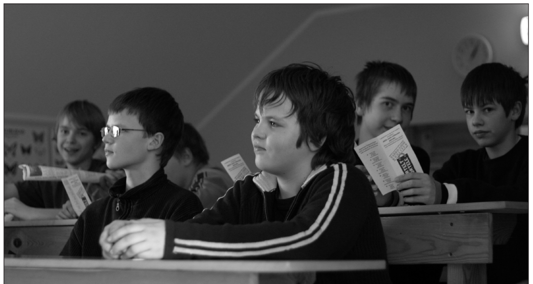
Eelmisel nädalal toimunud tervisenädalal hüpati kõrgust, mängiti mälumängu, valmistati tervisesalateid ja tehti paljut muud huvitavat. Pildil kuulab 7C klass loengut uimastitest.