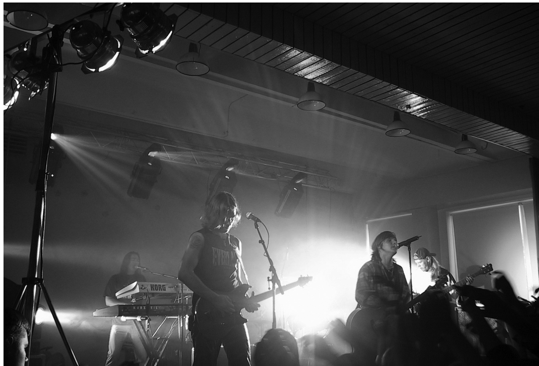
Terminaator annab igal kontserdil endast parima ja see haaras publikugi kaasa.