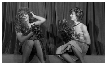
Lk. 1-3 Põhikooli Teatriõhtu oli igati positiivne