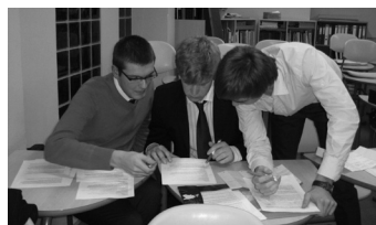
Lk. 4 KG väitlusklubi sõnasõjas SÜGikatega ja vabariigi parimatega