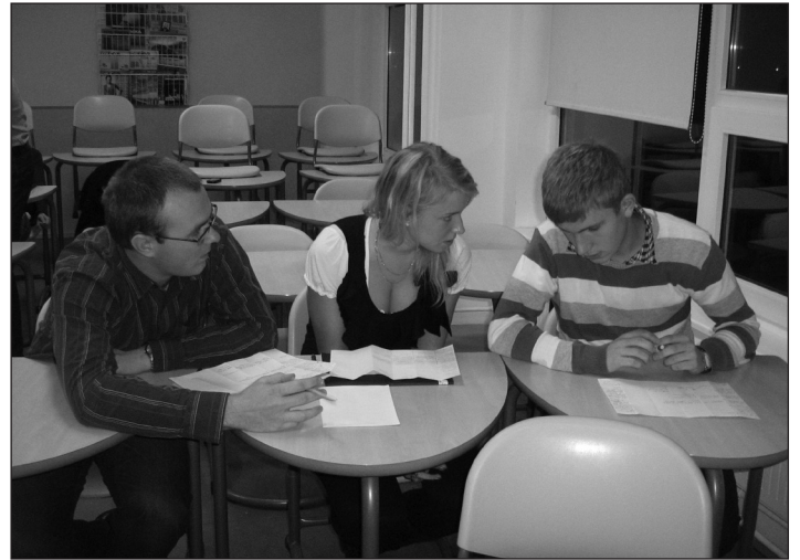
KG väitlusklubi meistrivõistlustel osalenud võistkond