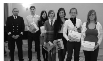
Lk. 5 A. Mälgu rannajutude konkursil said KG õpilased 4 preemiat