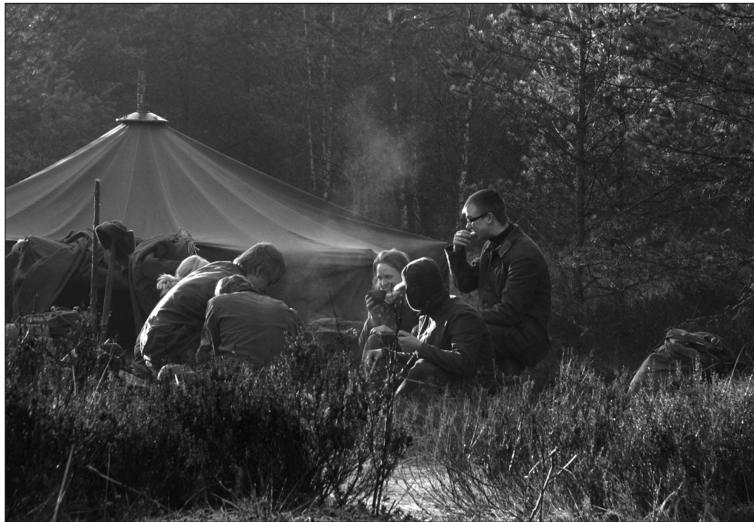
11. c klassi õpilased varajasel hommikusöögil Karujärve lähistel.

11. ja 12. klasside riigikaitseuuna valinud õpilased veetsid aprilli esimese nädalavahetuse Karujärvel laagris, mis oli paljude jaoks esmakordne sellelaadne kogemus.