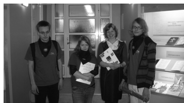
Lk. 2 Kuldsest Amuletist Siberini ehk Millega sai hakkama KG?