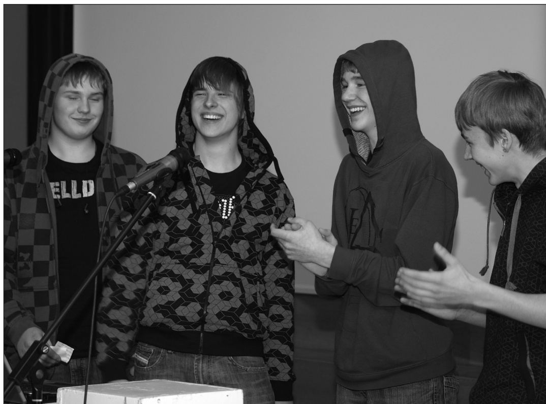
Vahvad räpparid 9B klassist.