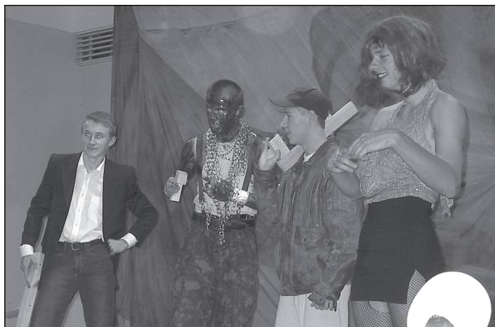
12c etenduse Kummile on appi tulnud A-rühm.

Saarepiiga jäi kõigile südamesse. Temas oli tunda eepose algset naiskuju. Näidend oli üks raskeima sisuga Suurel Teatriõhtul.