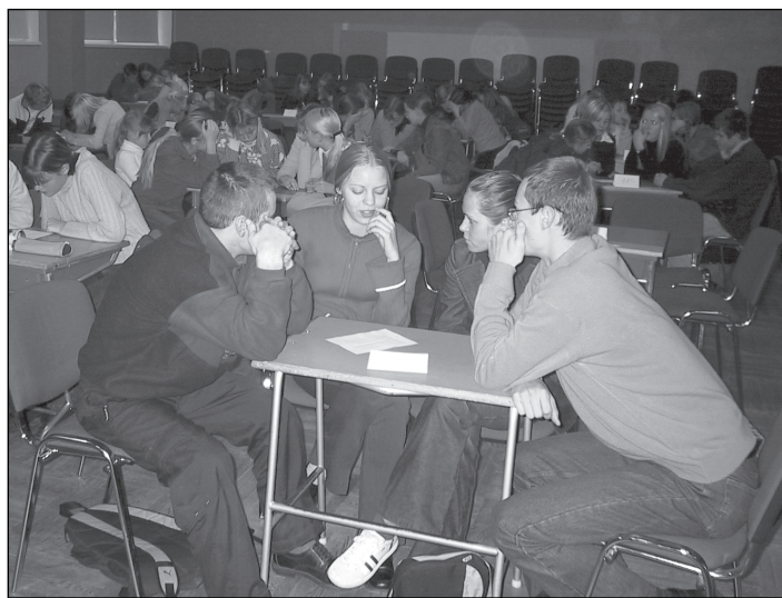
Pilt KG kirjanduspäevade raames toimunud kirjandusviktoriinilt.